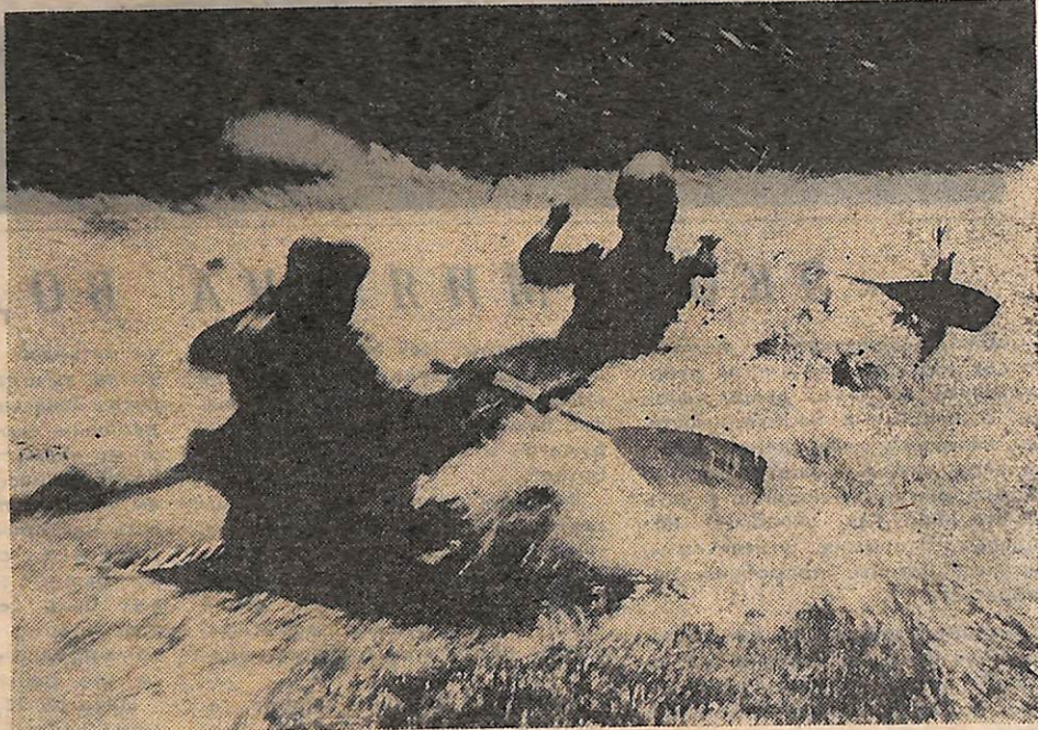
В коллекции народной фотостудии «Образ» значительное место занимают снимки, посвященные спорту. И это не случайно. Сегодня физическая культура и спорт стали неотъемлемой частью советского образа жизни.